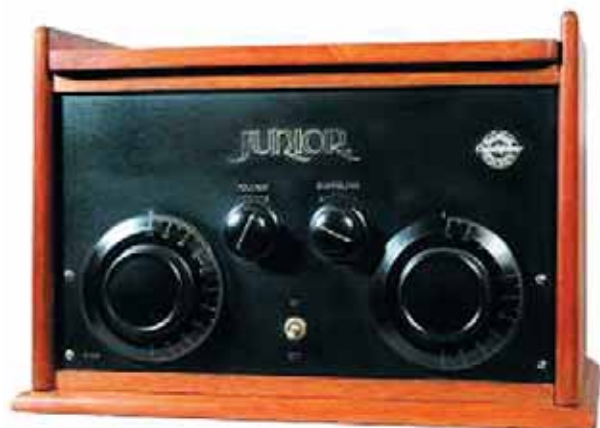
Figuur 3: Crystalphone Junior uit 1928. (foto auteur, collectie Frans Driesens)

Het merk Megatron was bij de inlevering in 1943 het meest vertegenwoordigd in de provincies Overijssel en Gelderland. Voor zover de beschikbare informatie reikt, is Hengelo recordhouder met 255 ingeleverde toestellen, gevolgd door Arnhem en Emmen met elk 68 stuks. Lent ligt tegen Nijmegen en mogelijk zijn in die stad ook veel toestellen ingeleverd.