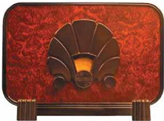
Figuur 1: Philips 820A, 5-lamps toestel uit 1931/1932. Van dit type zijn in 1943 8.000 stuks ingeleverd.

De getallen in de tabel geven waarschijnlijk een redelijke indruk van de verhouding waarin de toestellen ten tijde van de inlevering in 1943 bij de Nederlandse bevolking aanwezig waren. Een exact beeld zal het zeker niet zijn, want uit een analyse van de beschikbare gegevens blijkt, dat oudere toestellen in ruimere mate aangeboden zijn, terwijl met name de jongere en waardevollere toestellen zijn achtergehouden. Uitspraken over de verhoudingen die gelden voor de aanwezigheid van toestellen onmiddellijk na de bevrijding zijn uitermate speculatief. Er is immers geen nauwkeurig detailbeeld op type-niveau beschikbaar van de toestellen die zijn achtergehouden, afgevoerd of teruggegeven. En uitspraken over de verhoudingen die gelden voor hedendaagse verzamelingen zijn natuurlijk nog speculatiever. Kwalitatieve uitspraken zijn echter wel mogelijk. Een toestel dat in 1943 uitermate zeldzaam was zal dat vandaag de dag zeker ook nog zijn en verwacht mag worden dat toestellen die in 1943 in grote hoeveelheden zijn ingeleverd in hedendaagse verzamelingen nog op ruime schaal zullen voorkomen.