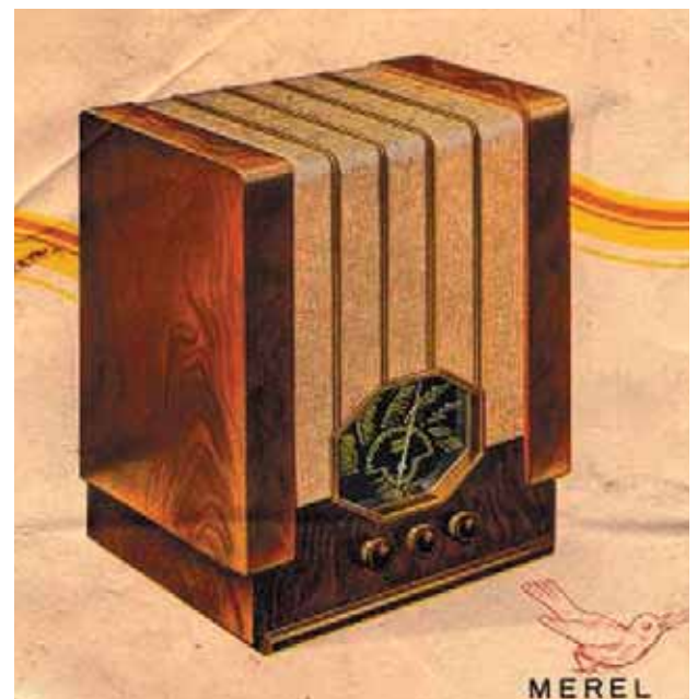
Figuur 2: Megatron type 238 (Merel)

Megatron is bij de meeste verzamelaars een weinig bekend merk. Het wordt ook maar nauwelijks in verzamelingen aangetroffen. Toch stond het merk met 5.000 exemplaren op de vijfde plaats van de Nederlands merken bij de inlevering in 1943. Veelzeggend is het feit dat het merk niet is opgenomen in Staleman's "Technisch commercieel radio vademecum" en evenmin in de lijst van ruim 500 Nederlandse radiomerken