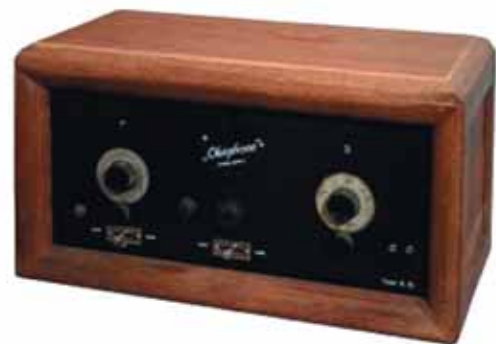
Figuur 3. Okaphone V.B. uit 1929 (foto auteur, collectie Frans Driesens).

Okaphone is het radiomerk van de firma Oscar Keip in Groningen. In deze provincie zijn de grootste aantallen Okaphone-toestellen ingeleverd (ongeveer een kwart van het totaal aantal van 600 toestellen), maar ook in de naburige provincies Friesland, Drenthe en Overijssel bleek Okaphone sterk aanwezig. Okaphone heeft veel types geproduceerd. De meest voorkomende types zijn V.B. en NIW (of NIW).