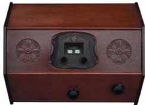
Figuur 2. Sinus A3, 4-lamps wisselstroomtoestel uit 1929.

Ridderhof en Van Dijk was aanvankelijk gevestigd in IJsselstein en later in Zeist en bouwde vanaf 1921 radio's met de merknaam Sinus. Simplex was het meest bekende type, maar in de registers vinden we ook types als Mercurius, S812, S813 en W125 terug. Van alle andere types wordt slechts een handvol aangetroffen.