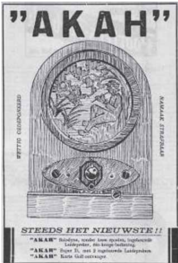
Figuur 8. AKAH, advertentie in KRO-gids van 1927.

In de registers zijn slechts 23 serienummers vermeld. Deze lopen van 207 tot 3143.