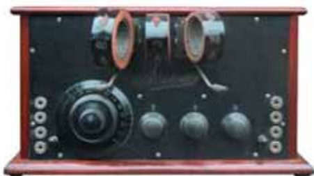
Figuur 9. Minimax O.V.3i uit omstreeks 1926 (foto auteur, collectie Radiotron).

Minimax had zijn basis in Noord-Brabant, aanvankelijk (vanaf 1924) in Beek en Donk en vanaf 1929 in Veghel. Veel van de naar schatting 180 ingeleverde toestellen waren dan ook afkomstig uit deze gemeenten (26 resp. 28 stuks). Buiten Noord-Brabant werd