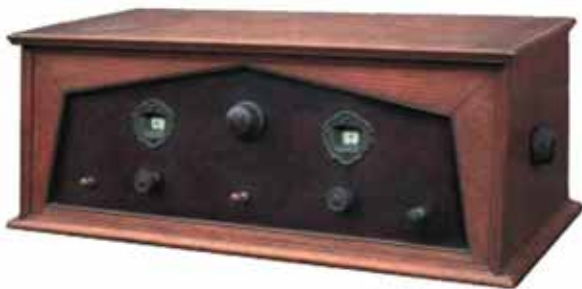
Figuur 1. Weco 3-11, 4-lamps wisselstroomtoestel uit 1928/1929.

Als gevolg van de licentiepolitiek van Philips zocht Weco omstreeks 1930 zijn heil in België en bracht daar toestellen op de markt met Amerikaanse buizen, die vrij waren van Philips-oc-trooien.